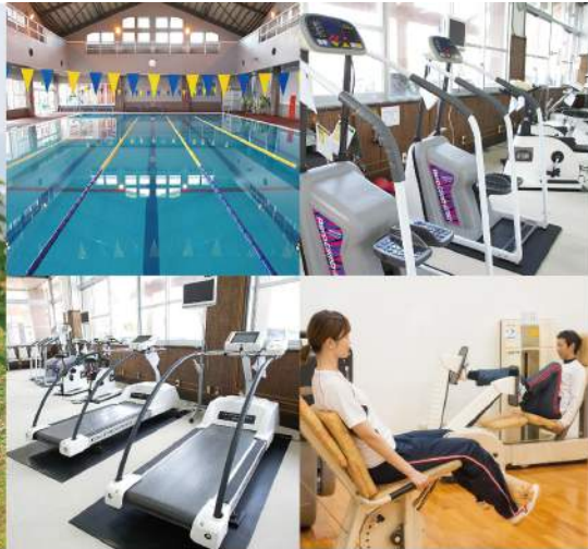
日帰りで利用できる様々なスポーツ施設を屋内外に備えています。